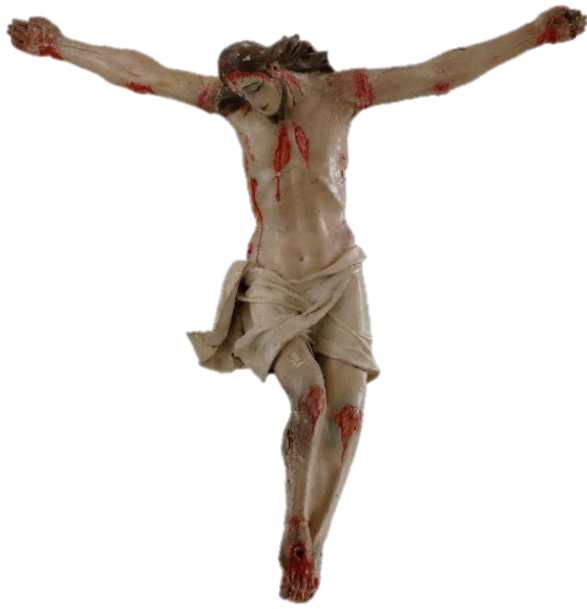
Figura 5 – Crocifisso, prima del restauro