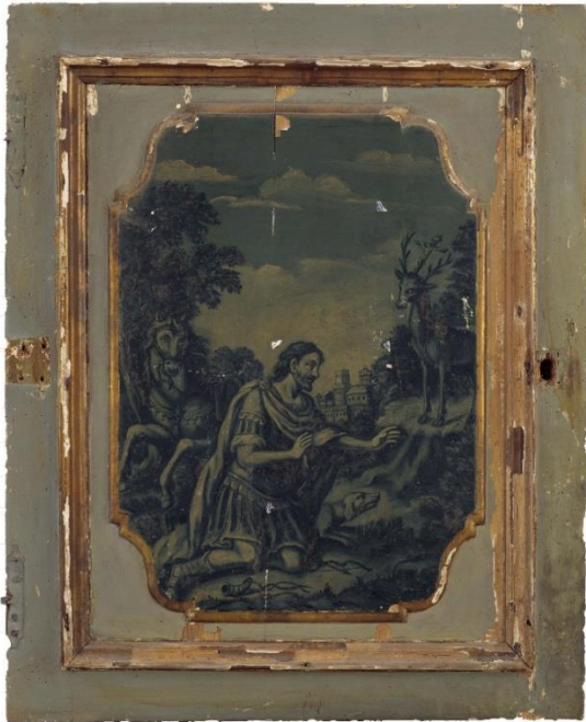
Figura 1 – Anta con scena della Conversione di Sant'Eustachio, prima del restauro