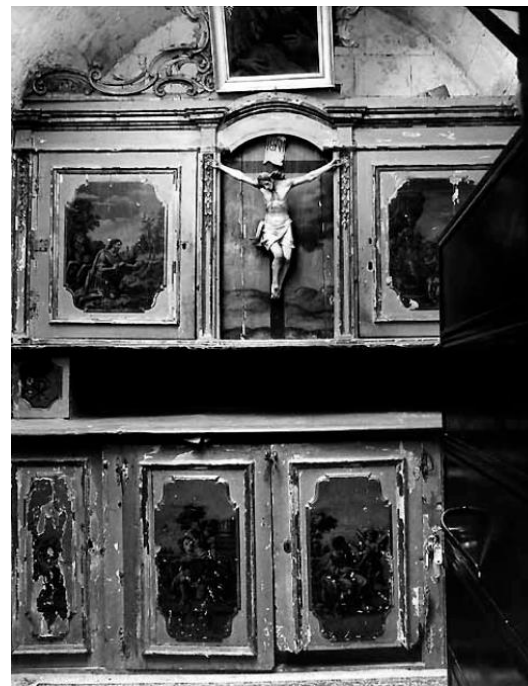
Figura 4 – foto d'archivio dell'armadio allestito con il Crocifisso centrale