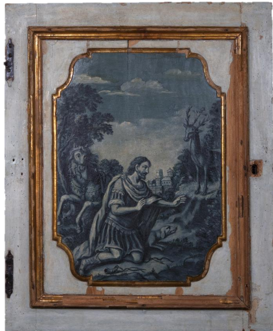
Figura 2 – Anta con scena della Conversione di Sant'Eustachio, dopo il restauro