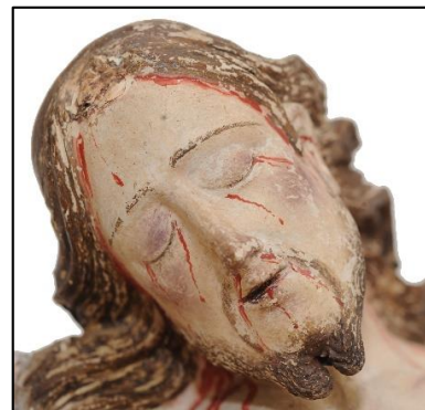
Figura 8 – Crocifisso, dettaglio del volto prima e dopo la rimozione della ridipintura