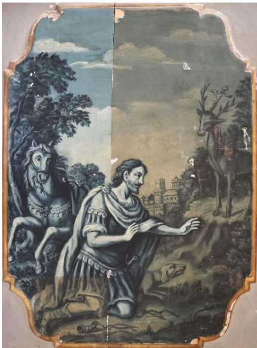
Figura 3 – Anta dipinta, tassello di pulitura