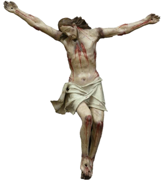
Figura 6 – Crocifisso, dopo il restauro